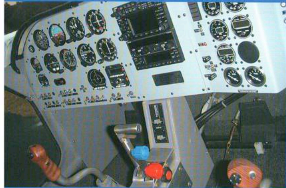
Het paneel, spartaans maar fraai.