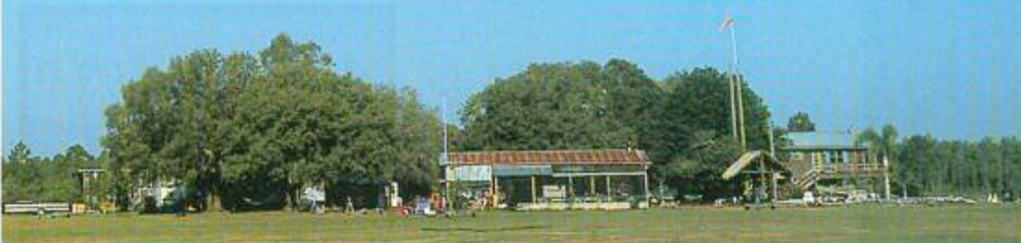
De Moyes Dragonfly en de reden van zijn bestaan: de zeilvlieger.

van 22 knopen, ideaal voor dit werk. We hebben er inmiddels vier van, dus op drukke dagen kunnen we tientallen delta's per uur de lucht in slepen."