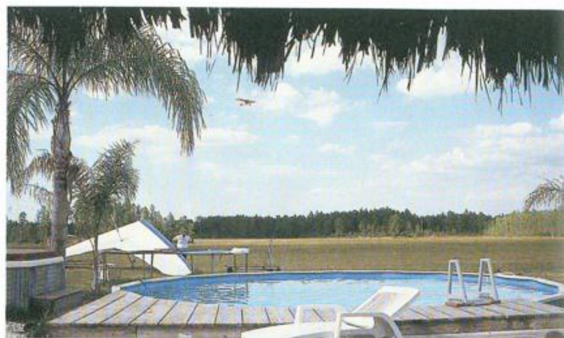
Ter afkoeling na het vliegen.

doorgaans in vluchtjes van hooguit een minuut worden opgebouwd. Wie wel eens op een beginnershelling een zware deltavlieger telkens maar weer omhoog heeft gesjouwd zal dit als muziek in de oren klinken. Want voordat je van de instructeur in Frankrijk de berg af mag, heb je jezelf welhaast een hernia gesjouwd op een helling in het Sauerland of de Ardennen. Geen wonder dat de deltavliegsport vanouds veel enthousiaste beginners telt, maar veel minder volhouders. Zeker in deze gemakzuchtige tijd. Lieren is ook een prima methode en wordt in Nederland onder andere op het deltaveld van Nieuwvliet bij Breskens beoefend. Maar eerlijk is eerlijk: een delta leren vliegen achter zo'n Dragonfly, is wel het meest comfortabel. Goedkoop is het niet: voor je solo bent, heb je aan instructie, huur en slepen toch wel een slordige 800 dollar uitgegeven. Maar sneller en comfortabeler is de sport moeilijk te meesteren.