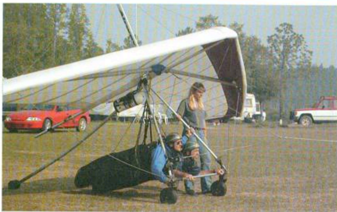
Opperste concentratie voor de start.

Voor meer informatie: www.dragonfly-germany.de