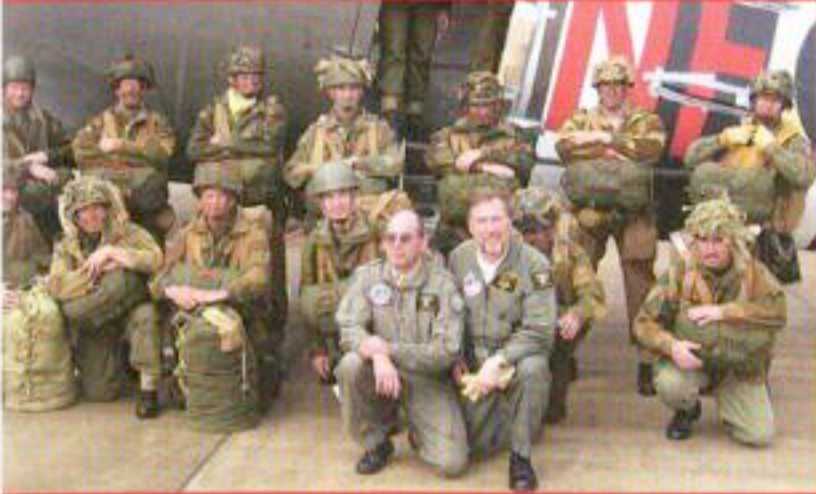
Linksboven: In de originele rol tijdens de herdenking van het Ardennen-offensief...