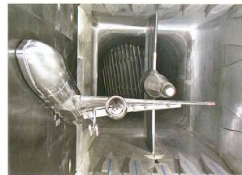
Lekker hoge neusstand in de windtunnel van de NASA.

Anders ligt dat met het geluid op de grond. Daar zijn al zoveel woorden aan vuil gemaakt en zoveel miljoenen onderzoeksgeld besteed, dat we er hier maar niet verder op in gaan. Groot nieuws is op dit gebied nauwelijks te verwachten. Toch heeft de Dreamliner ook op dit gebied wel het nodige te bieden. Er is eindeloos gepield met een nieuw soort uitlaten, die verrassend veel lijken op de kroon die sprookjeskoningen wel eens op hun hoofd hebben. Daarmee zijn flinke geluidsreducties te bereiken. Al zegt Yu erbij dat veel meer te verwachten valt van slimmere routes en meer consistentie en samenwerking op het gebied van de verkeersleiding. Daarvoor moet echter een boel politiek water naar de zee worden gedragen. Ze verwijst Europa daarvoor handig naar de onderhandelingstafel. "Boeing heeft z'n best gedaan", vindt Jeanne Yu. ✕