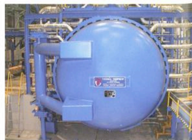
De kunststofdelen van de 787 worden in gigantische autoclaven 'gebakken'.

Tot zover is het nog redelijk simpel. Ingewikkelder is, dat conventionele metalen rompen niet