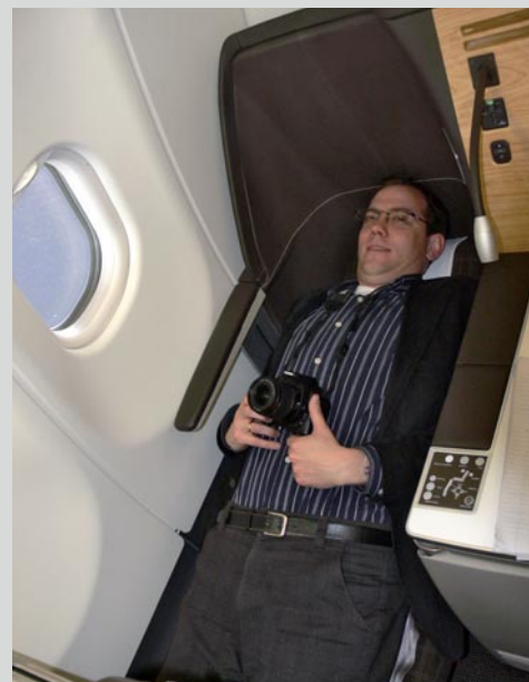
De man van luchtvaartnieuws.nl neemt het er weer eens van.