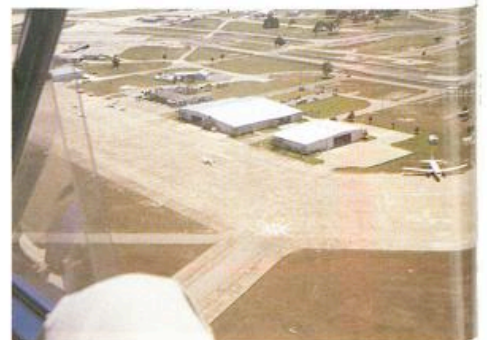
De moderne faciliteit van Leza Lockwood. Rechts ligt het beroemde Sebring racecircuit.

Feit is dat de twee motoren in de USA wél wat administratieve problemen geven. Het toestel is in Amerika gecertificeerd als een 'experimental', en als zodanig is er geen sprake van een type-, of 'twinrating'. De Amerikaanse verzekeraars zijn minder soepel, die verlangen toch een 'twinrating' om de AirCam te mogen vliegen.