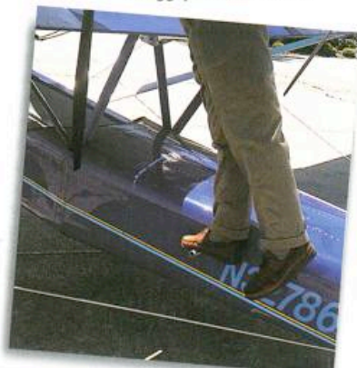
Het praktische opstapje voor de check van de beide hooggeplaatste motoren.

van pakweg 600 vierkante meter, is een voorbeeld van hoe de 'general aviation' in Amerika na twintig jaar stilstand weer klimt als een jet met naverbrander. Nieuw, modern en efficiënt.