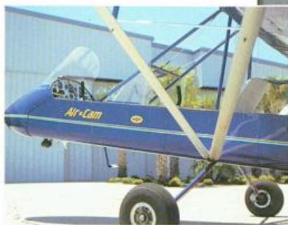
Het vrije uitzicht voor de piloot en passagier is gigantisch. De AirCam is geknipt voor het observeren van bijvoorbeeld alligators.

Standaard wordt de AirCam geleverd met twee Rotax-moto-