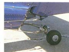
Het staartwiel is geleend van de Maule.

ren, maar ook hier is wat denkwerk op losgelaten. Als je voor National Geographic boven het Braziliaanse regenwoud hangt om de laatste zes Koerie-Koerie's te observeren, dan wil je natuurlijk niet een herrie maken als twee opgevoerde Zündapps voor een frietentent. Vandaar dat Leza Lockwood een speciaal roestvrijstalen uitlaatsysteem heeft ontwikkeld, dat het vermogen redelijk op peil houdt, maar de herrie dempt. Een welhaast zwevende vlucht boven ongerepte natuurgebieden is het resultaat. 'Custom tuned'.