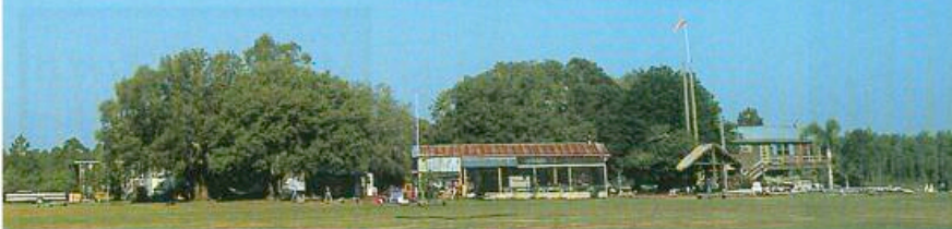
De Moyes Dragonfly en de reden van zijn bestaan: de zeilvlieger.

van 22 knopen, ideaal voor dit werk. We hebben er inmiddels vier van, dus op drukke dagen kunnen we tientallen delta's per uur de lucht in slepen."