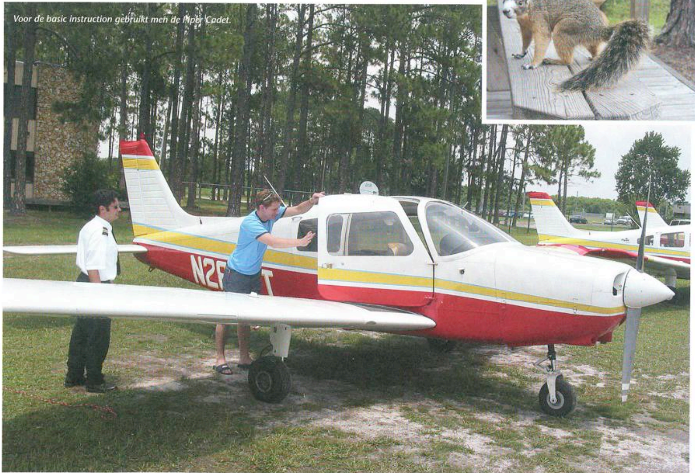
Voor de basic instruction gebruikt men de Piper Cadet.

eens goed doornemen. Dan valt het reuze mee. Heeft men zo'n bekende niet, dan kan men eventueel een dag lang een Nederlandse instructeur inhuren, en wat aanvullende lokale kennis op doen. Dat kan heel praktisch en verstandig