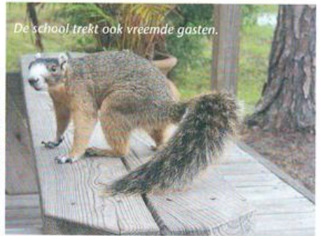
De school trekt ook vreemde gasten.