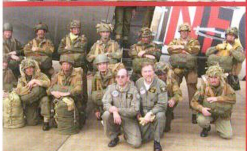
Linksboven: In de originele rol tijdens de herdenking van het Ardennen-offensief...