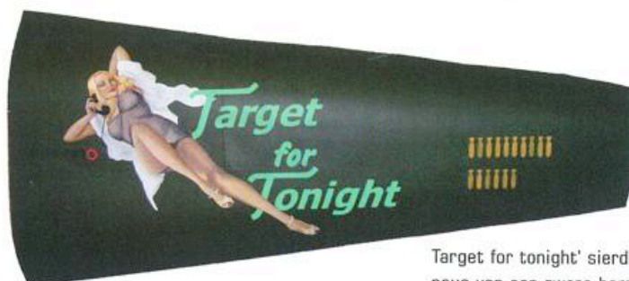
Target for tonight' sierde in de oorlog de neus van een zware bommenwerper.

Deze specifieke pinup is het bewijs dat de piloten in tekst verder durfden te gaan dan in beeld. De basiscommandanten spraken hun veto over al te vrijmoedige afbeeldingen uit. Er heeft zich op hoger niveau ook wel enige discussie voorgedaan onder behoudende krachten in het leger en politiek. Maar tot maatregelen kwam het niet. Dit omdat het Amerikaanse publiek vond dat men de jongens die zo ver van huis voor de