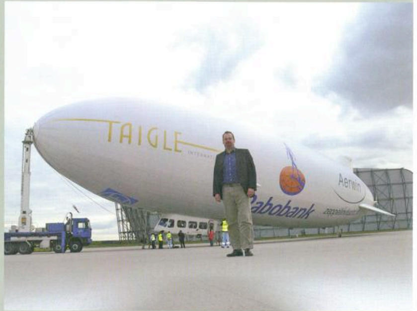
Krijger voldaan na aankomst Finkerwerder.

De zeppelin blijkt ook tijdens deze ferry zeer