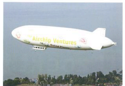
In Amerika is de NT al door de FAA gecertificeerd.