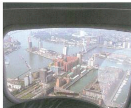
Rotterdam vanaf het bankje in de achtersteven.