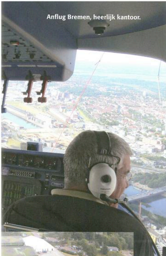
Anflug Bremen, heerlijk kantoor.